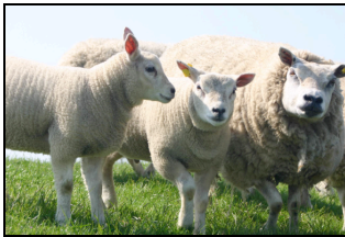
Figuur 7: De Texelaar

De schapenboeten in het Zuid-TEXELSE landschap werden gebruikt voor de opslag van hooi en gereedschappen en dus niet als schaapskooi, zoals men zou kunnen vermoeden. De boeten worden gekenmerkt door een asymmetrische vorm met een aflopende zijde en een rechte zijde. Bijna alle schapenboeten op Zuid-TEXEL hebben de schuin aflopende zijde op het westen of zuidwesten gericht. Dit is omdat op het eiland een overheersende (zuid-)westenwind waait. Het asymmetrische ontwerp van de boeten vormt op deze wijze een schuilplaats voor de schapen bij harde en koude wind. De specialistische schapenhouderij in de regio en op de rest van het eiland wordt ook geïllustreerd door de verkoop van de beroemde Texelse schapenkaas en van wol. De Texelaar is een historisch ras, een kruising van een hoornloos Nederlands ras dat goede wol gaf met Leicestershire en Lincolnshire schapen, die bekend stonden om hun uitstekende vlees.