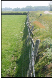
Figuur 5: Tuunwal in de buurt van Noordhaffel.