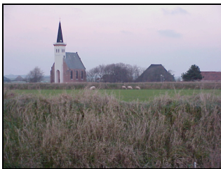
Figuur 2: De kerk van Den Hoorn

Ten zuiden van Den Westen ligt de ongeveer 6 meter hoge heuvel "Het Klif". In de 12e eeuw stond hier de nederzetting het Clijf, aan de oevers van het Marsdiep. Nadat de baai verzilt was, trokken de vissers naar het zuiden en stichtten zij het dorp Den Oude Hoorn. Na de vernietiging van deze middeleeuwse nederzetting door de Friezen in 1398, vestigden de dorpingen zich opnieuw op het Klif, waarmee ze het lintdorp Den Hoorn stichtten. Het dorp lag eerst nabij de zeekust, maar als gevolg van landaanwinning en –aangroei in de afgelopen eeuwen ligt Den Hoorn nu verder landinwaarts. Vroeger leefden de bewoners van Den Hoorn van de landbouw (met name schapenhouderijen in de duinen ten westen van het dorp), visserij, walvisvaart en het loodsen van schepen door het gevaarlijke kustgebied met zijn geulen, ondiepten en slikken, met name het Marsdiep in het zuiden. Vroeg in de 15e eeuw werd een kerk gebouwd, ter vervanging van een eerdere houten kapel. De – inmiddels beroemde - witte kerk kreeg in 1450 een toren die eveneens als baken voor schepen op de Noordzee diende. Oorspronkelijk lag de kerk in het dorpscentrum, maar nadat de loodsactiviteiten in de 19e eeuw terugliepen (zie hieronder ), werden meerdere huizen gesloopt. Als gevolg hiervan ligt de kerk nu aan de rand van Den Hoorn. Het landschap rond Den Hoorn wordt thans vooral gekenmerkt door bloembollenteelt (met name narcissen) en grasland. Het historische dorp staat op de monumentenlijst.