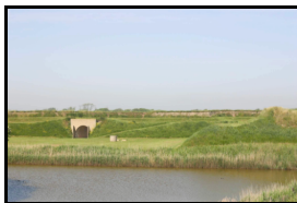
Figuur 8: De Oude Schans.

In de regio Zuid-Texel zijn verscheidene overblijfselen te vinden van het militaire verleden van het eiland. In het meest oostelijk gelegen deel van de regio, nabij het havendorp Oudeschild, ligt de Oude Schans uit de Tachtigjarige Oorlog. De Oude Schans werd in 1572 gebouwd ter bescherming van de haven van Oudeschild, die als voorpost werd gebruikt door oorlogsschepen en handelsschepen van de VOC die door het Marsdiep voeren. De schans werd ontworpen door Adriaan Anthonisz (1541-1620). De aarden wallen en bastions waren gelegen in een moerassig gebied dat onder water kon worden gezet. In 1810 werd Holland ingelijfd bij het Franse keizerrijk. De schans werd uitgebreid en verbeterd en werd onderdeel van de Stelling van Den Helder. Tijdens deze periode werden aan weerszijden van de schans twee kleine redoutes gebouwd: de lunette en de redoute. Beide forten werden gebouwd met simpele aarden wallen en dienden ter bescherming van de Oude Schans. In de jaren dertig werden delen van de fortificaties vergraven en de grond werd gebruikt om de dijken te versterken. Sinds 1958 is de Oude Schans in handen van Natuurmonumenten, die het fort in de jaren '90 heeft gerestaureerd.