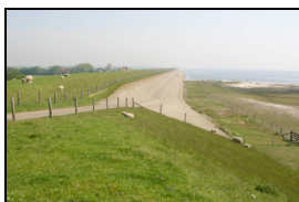
Figuur 4: De zeedijk in de Prins Hendrikpolder.

In 1555 brak de polderdijk door, gevolgd door andere dijkdoorbraken in 1571 en 1591. Door deze doorbraken ontstonden poelen of kolken, zogeheten wielen. Een grote pool nabij de Kuildijk vormt nu een belangrijk toevluchtsoord voor vogels tijdens de vloed. In de 18e eeuw vormde het gebied verder naar het oosten nog een groot kweldergebied. De eerste poging tot inpoldering vond plaats in 1770, waardoor de polder van Hoorn en Burg ontstond. Als gevolg van slecht dijkonderhoud liep de polder echter al in 1792 weer onder. Pas in 1846-1848 werd het gebied permanent ingepolderd als de Prins Hendrikpolder.