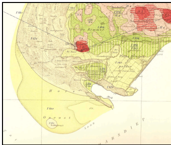
Figuur 1: De geologie van Zuid-Texel

Texel is het meest westelijk gelegen Waddeneiland en wordt – net als de andere Waddeneilanden – gekenmerkt door een dynamisch milieu. Het landschap bestaat uit door de wind gevormde zandduinen, bedijkte kwelders, veengronden en de uit het Pleistoceen daterende keileembulten op de zuidelijke helft van het eiland, waarvan De Hooge Berg met 15 m boven N.A.P. het hoogst is. Texel is het enige Nederlandse Waddeneiland waar zulke pleistocene heuvels voorkomen. Op deze heuvels en op de omringende zandvlakten treffen we de oudste nederzettingen op Texel aan, zoals Den Burg, Oudeschild en Den Hoorn. Dit deel van Texel wordt nog steeds 'het oude land' genoemd.