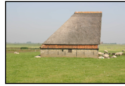
Figuur 6: Schapenboet in de buurt van Noordhaffel

De schapenboeten in het Zuid-TEXELSE landschap werden gebruikt voor de opslag van hooi en gereedschappen en dus niet als schaapskooi, zoals men zou kunnen vermoeden. De boeten worden gekenmerkt door een asymmetrische vorm met een aflopende zijde en een rechte zijde. Bijna alle schapenboeten op Zuid-TEXEL hebben de schuin aflopende zijde op het westen of zuidwesten gericht. Dit is omdat op het eiland een overheersende (zuid-)westenwind waait. Het asymmetrische ontwerp van de boeten vormt op deze wijze een schuilplaats voor de schapen bij harde en koude wind. De specialistische schapenhouderij in de regio en op de rest van het eiland wordt ook geïllustreerd door de verkoop van de beroemde Texelse schapenkaas en van wol. De Texelaar is een historisch ras, een kruising van een hoornloos Nederlands ras dat goede wol gaf met Leicestershire en Lincolnshire schapen, die bekend stonden om hun uitstekende vlees.