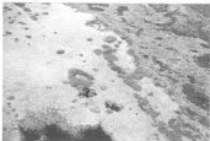
Lepelaarskolonie in De Geul

Het geplande recreatiedoel is niet aanwezig. Zowel de voorzieningen als de aantallen bezoekers en hun tevredenheid komen niet overeen met recreatiedoel 'boven het basisniveau', maar met recreatiedoel 'basisniveau'. Aangezien het ongewenst is het voorzieningenniveau aan te passen wordt overgegaan tot het vaststellen van recreatiedoel 'basisniveau'. Mogelijk is het recreatiedoel wel juist indien het hele Nationaal Park Duinen van Texel gebied integraal wordt beoordeeld.